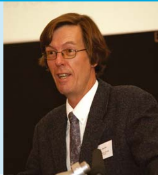
An tUas. Jon File ag labhairt leis na rannpháirtithe ag an Seimineár Comhairliúcháin ar Phlean Straitéiseach an ÚAO, 25ú Deireadh Fomhair 2006.