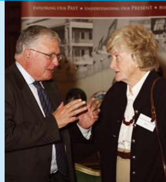
Rannpháirtithe ag Seimineár Comhairliúcháin um Plean Straitéiseach ÚAO 25ú Deireadh Fómhair 2006.