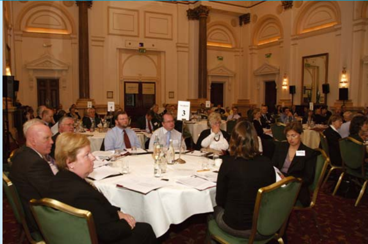
Rannpháirtithe ag Seimineár Comhairliúcháin um Plean Straitéiseach ÚAO 25ú Deireadh Fómhair 2006.