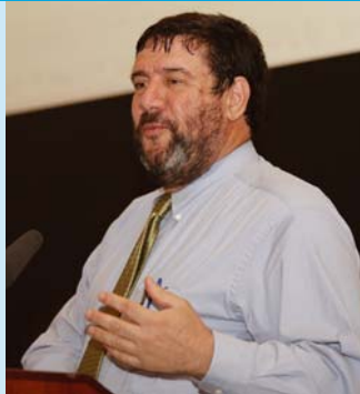
An tUas. Art Hauptman ag labhair leis na rannpháirtithe ag Seimineár Comhairliúcháin um Plean Straitéiseach ÚAO 25ú Deireadh Fómhair 2006.